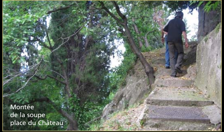
Montée de la soupe place du Château